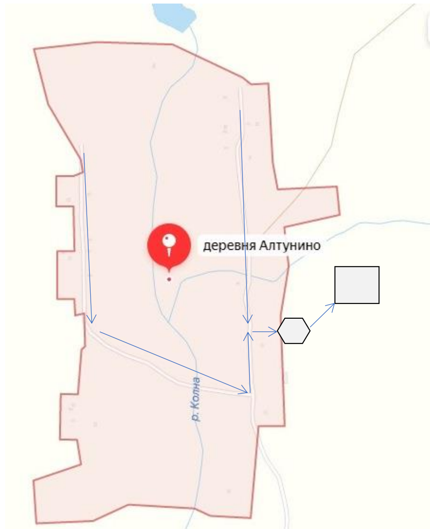
Схема выпаса и прогона сельскохозяйственных животных и птицы на территории деревни Алтунино