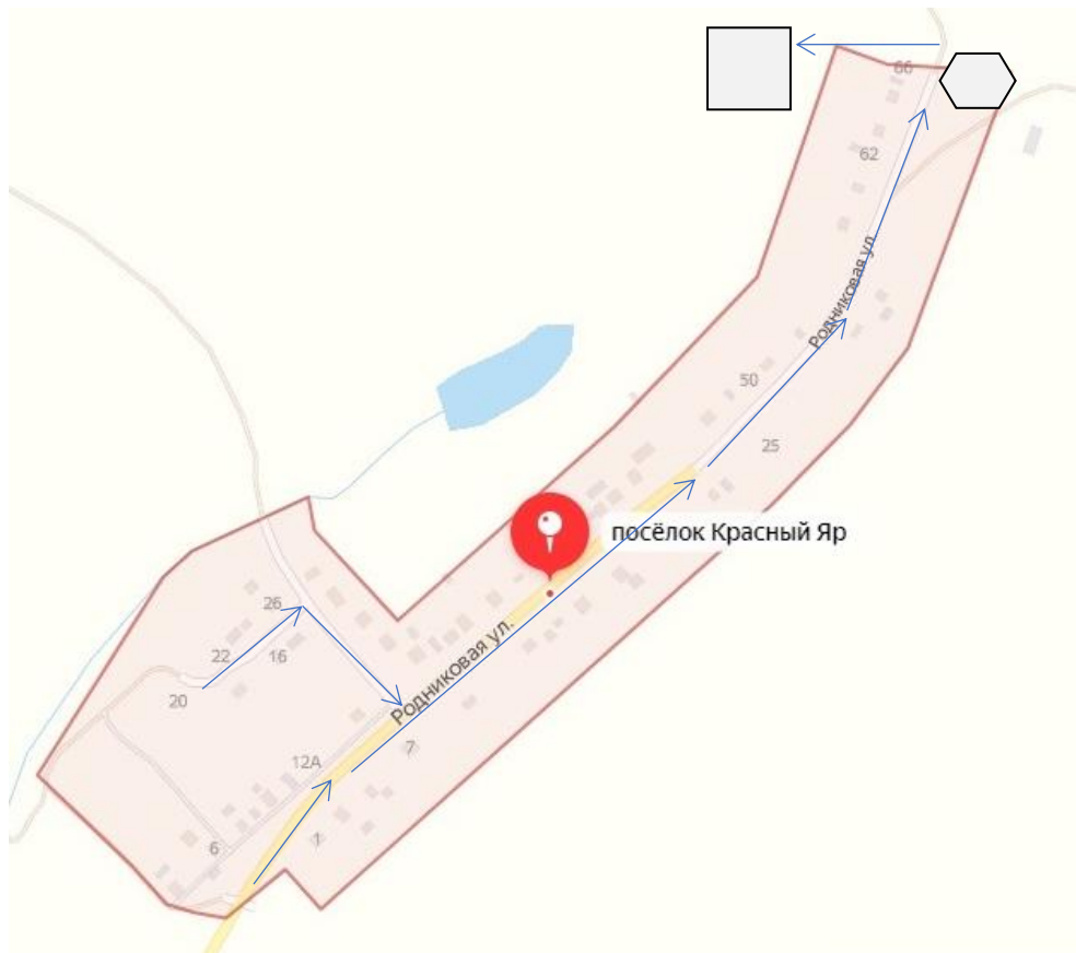
Схема выпаса и прогона сельскохозяйственных животных и птицы на территории поселка Красный Яр