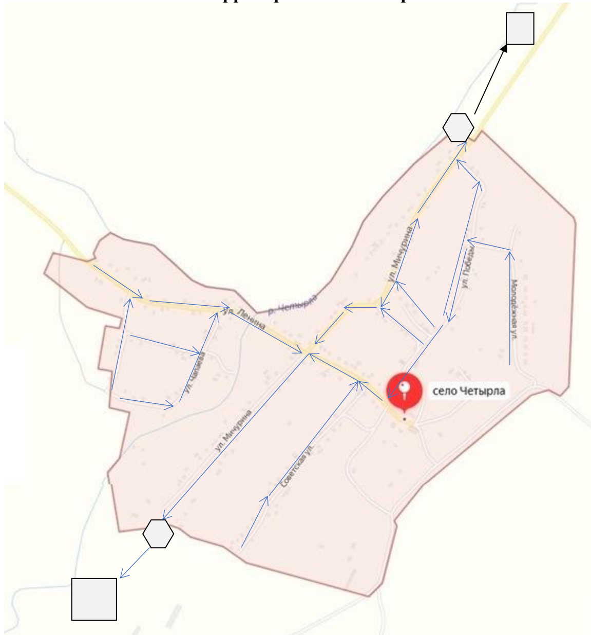
Схема выпаса и прогона сельскохозяйственных животных и птицы на территории села Четырла